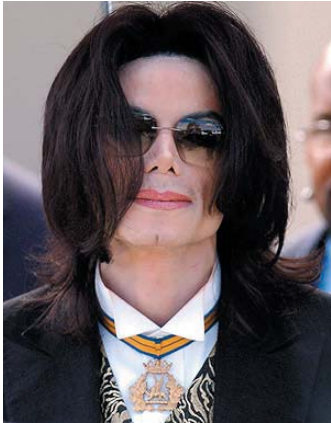
3. Michael Jackson