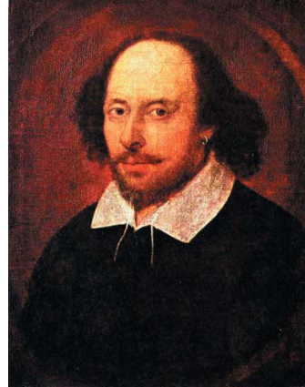
6. William Shakespeare