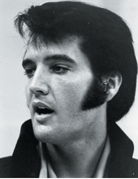
1. Elvis Presley