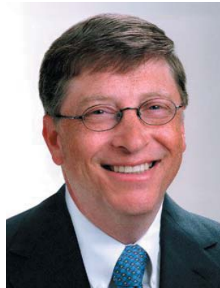
8. Bill Gates