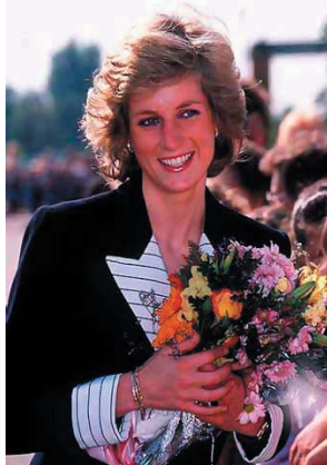
2. Diana de Gales, Lady Di